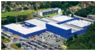
Hörmann KG Amshausen, Deutschland