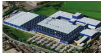
Hörmann KG Brandis, Deutschland