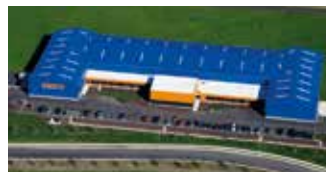
Hörmann Flexon LLC, Burgettstown PA, USA