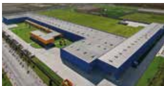
Hörmann Tianjin, China