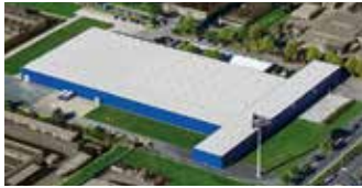
Hörmann KG Dissen, Deutschland