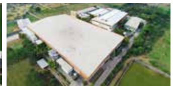
Shakti Hörmann Pvt. Ltd., Indien

Als einziger Hersteller auf dem internationalen Markt bietet die Hörmann Gruppe alle wichtigen Bauelemente aus einer Hand. Sie werden in hochspezialisierten Werken nach dem neuesten Stand der Technik gefertigt. Durch das flächendeckende Vertriebs- und Servicenetz in Europa und die Präsenz in Amerika und Asien ist Hörmann Ihr starker, internationaler Partner für hochwertige Bauelemente. In einer Qualität ohne Kompromisse.