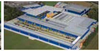
Hörmann KG Brockhagen, Deutschland