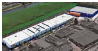
Hörmann Alkmaar B.V., Niederlande