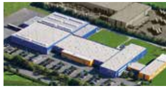
Hörmann KG Antriebstechnik, Deutschland