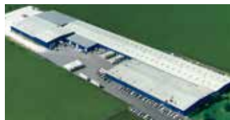
Hörmann LLC, Montgomery IL, USA