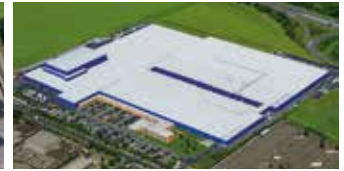
Hörmann KG Ichtershausen, Deutschland