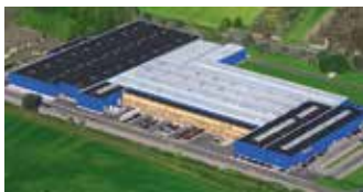
Hörmann KG Werne, Deutschland