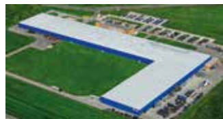
Hörmann Legnica Sp. z o.o., Polen