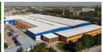
Hörmann Beijing, China