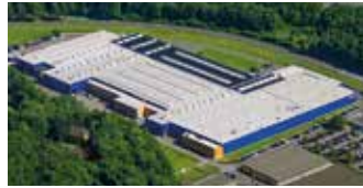
Hörmann KG Eckelhausen, Deutschland