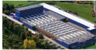
Hörmann KG Freisen, Deutschland